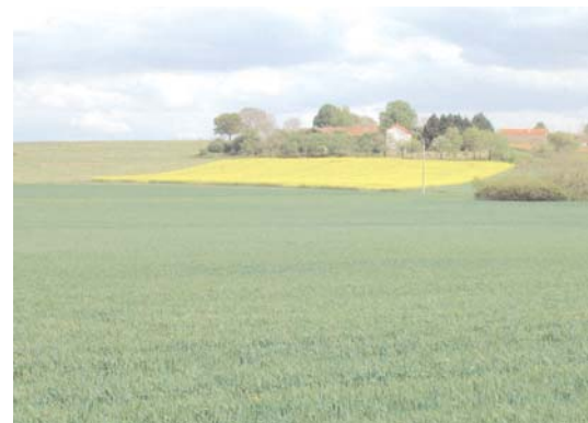
Champ de blé